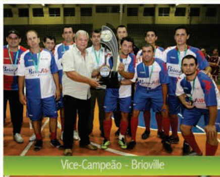
Vice-Campeão - Brioville