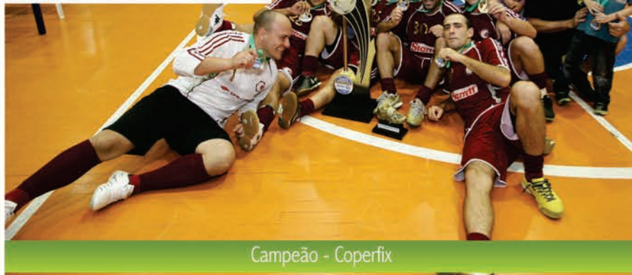
Campeão - Coperfix