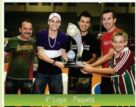
4º Lugar - Paquetá