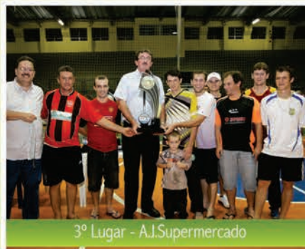
3º Lugar - A.J.Supermercado