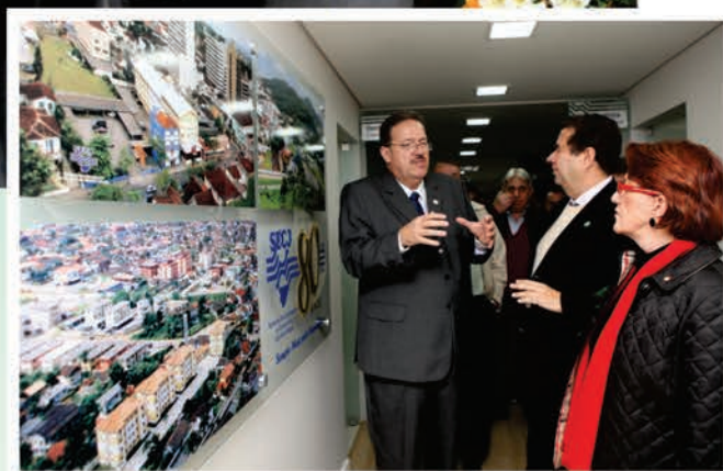
Convidados conhecem instalações