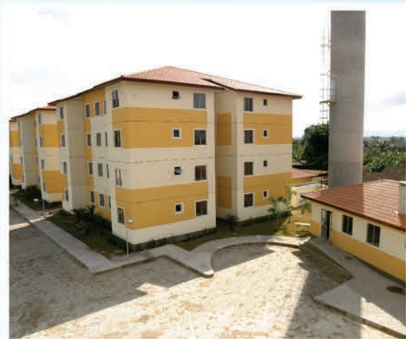
Solar dos Comerciantes I, no bairro Aventureiro

Dezenas de famílias de comerciantes já são beneficiadas pelo Programa de Habitação do Comerciante e em breve você que é associado poderá também se beneficiar deste importante projeto que o Sindicato realiza em parceria com o Governo Federal através do Programa Minha Casa, Minha Vida.