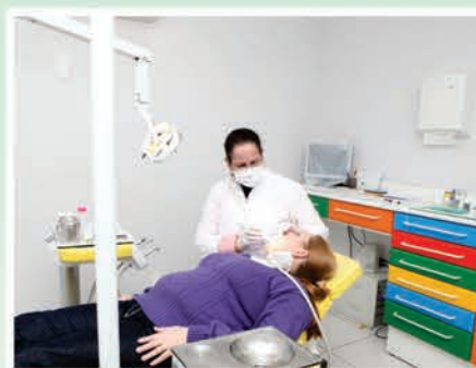
Modernos equipamentos odontológicos

O presidente Mazinho e a diretoria do Sindicato entregaram ao Ministro a comenda de sócio honorário. Carlos Lupi elogiou o SECJ por ser uma entidade moderna que oferece excelentes instalações e serviços para os trabalhadores do comércio. É um modelo a ser seguido nacionalmente! E tudo isso foi feito pra você, comerciante. Aproveite, esta sede é sua!