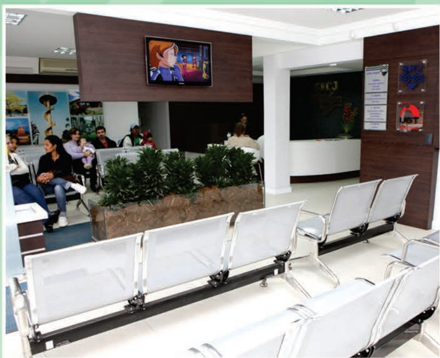
Recepção moderna e confortável