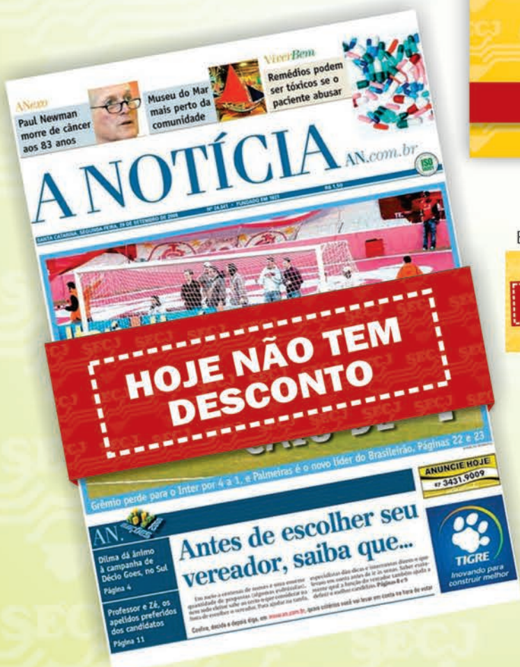
Cinta envolvendo jornal