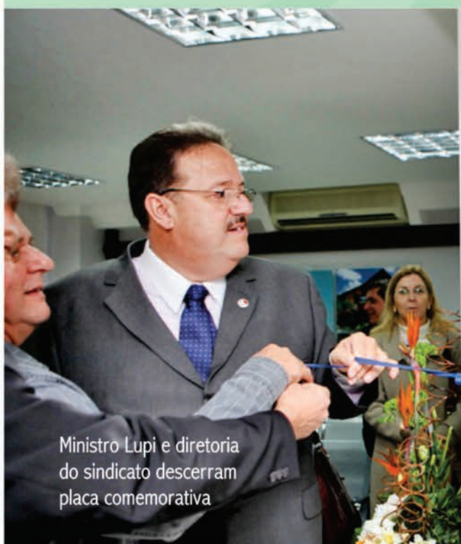
Ministro Lupi e diretoria do sindicato descerram placa comemorativa

Um novo momento na história dos 80 anos do SECI