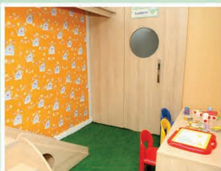
Nova e divertida brinquedoteca