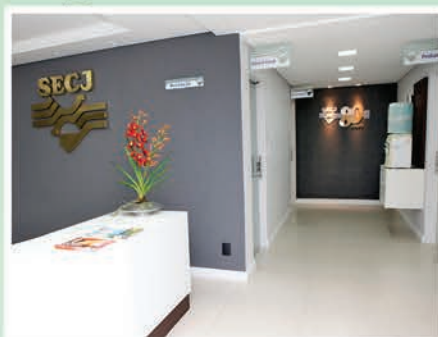
Conforto, qualidade e beleza