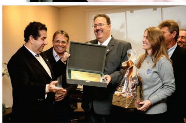
Ministro recebe comenda de sócio honorário