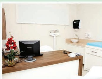
Novos consultórios médicos