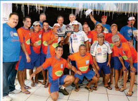
1º Lugar Geral Equipe Líder Vermelha