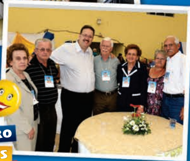
ENCONTRO DE SÓCIOS APOSENTADOS