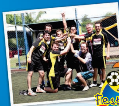
Festival do Galeto