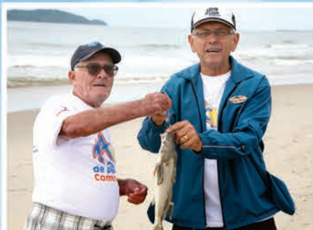
1º Lugar Sócio Aposentado Equipe Albatroz