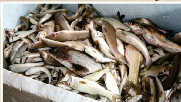
Doação dos peixes para Fundação Paulo Madi