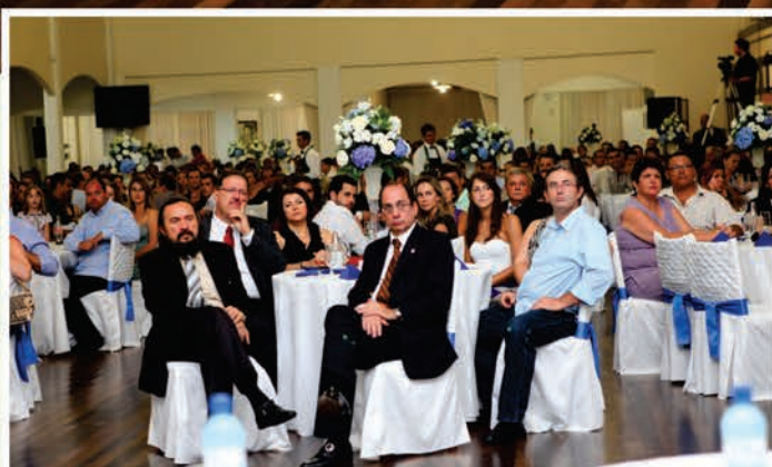
Sindicalistas de todo o estado e comerciários convidados prestigiaram o evento