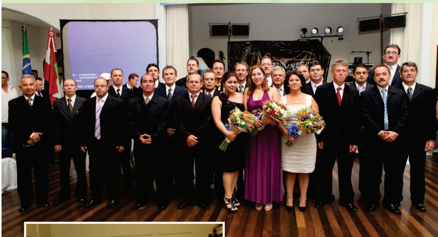
Atual diretoria empossada