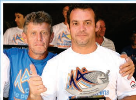
1º Lugar Peixe mais pesado Equipe Tio e Sobrinho