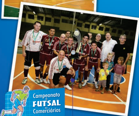
Campeonato de FUTSAL dos Comercários