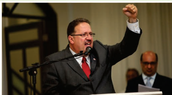
Discurso do presidente Mazinho