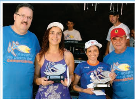
1º Lugar Feminino Equipe Tia e Sobrinha