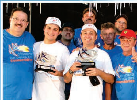
1º Lugar Sócios Equipe Madville