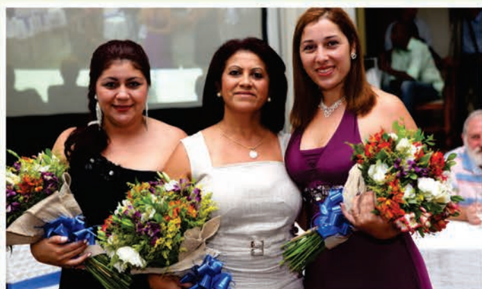
Atuais diretoras são homenageadas

No último dia 27 de janeiro de 2011, foi empossada a Diretoria 2011-2016. O evento realizado nos salões da Sociedade Glória de Joinville contou com a presença de autoridades políticas, sindicais, representantes do poder público, sócios do Sindicato e parceiros da entidade. Em seu discurso, o presidente Mazinho reforçou o compromisso de cada vez mais o Sindicato atender e superar as expectativas dos comerciários de Joinville e região e destacou o ingresso de mais uma categoria para compor a base do SECI: a dos funcionários dos escritórios de contabilidade. O presidente nacional da UGT, sr. Ricardo Patah, destacou mais uma vez as iniciativas do SECI e lembrou do exemplo que esta entidade representa para o cenário sindicalista nacional.