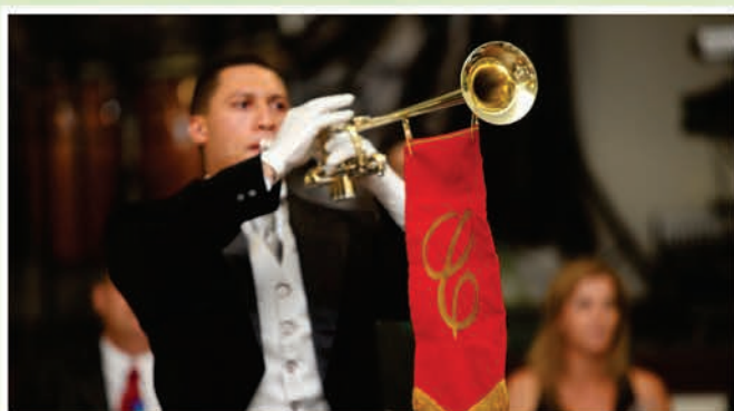
Trompetes anunciaram o início da posse