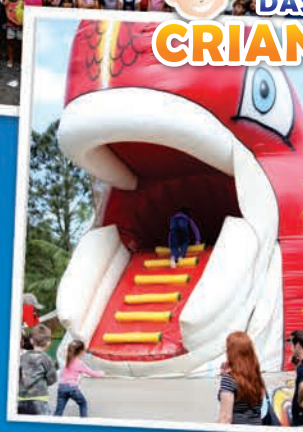
DIA DAS CRIANÇAS