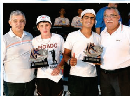
1º Lugar Juvenil Equipe Butiá Juvenil