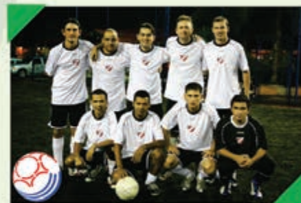
3º Lugar Equipe: ANGELONI