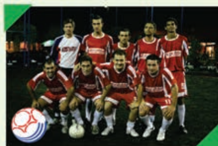
4º Lugar Equipe: SHERER AUTO PEÇAS