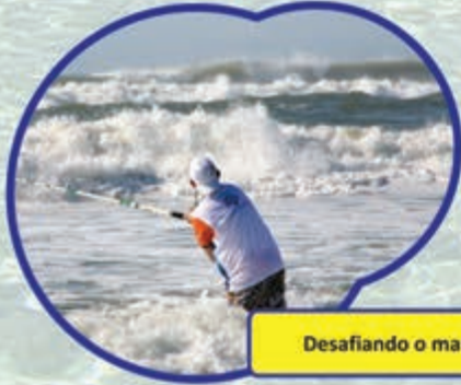
Desafiando o mar