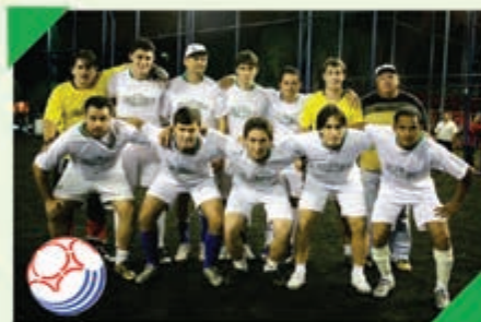
1º Lugar Equipe: FLABICAR