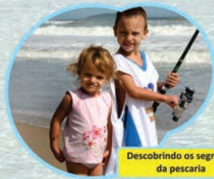
Descobrimos os segredos da pescaria