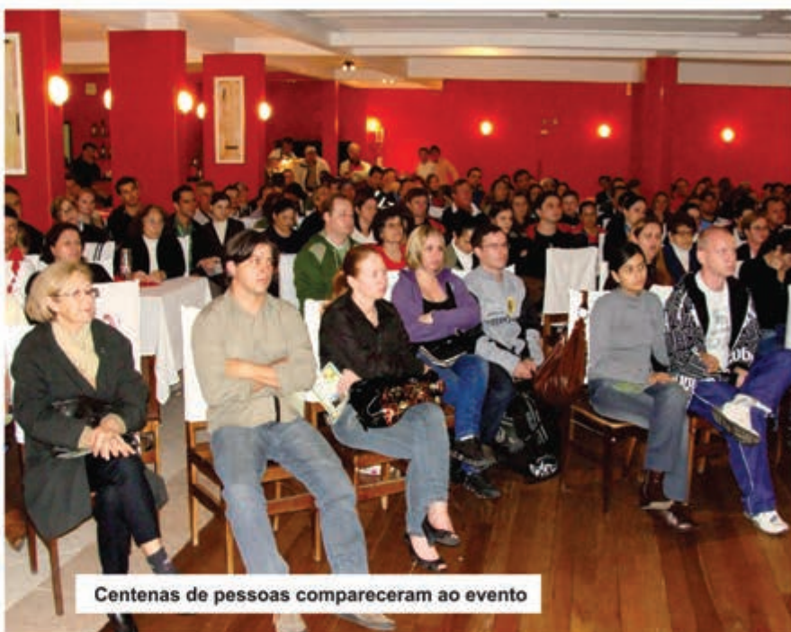
Centenas de pessoas compareceram ao evento