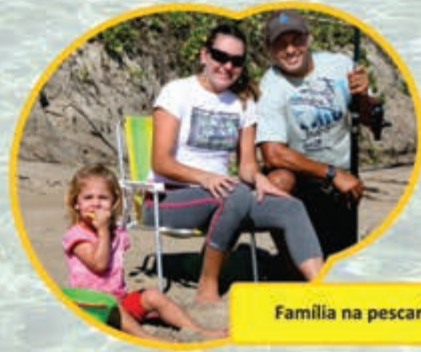
Família na pescaria