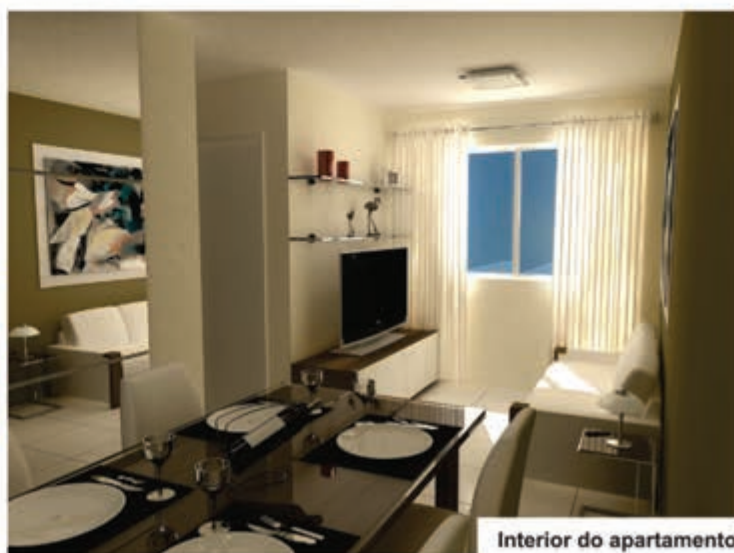
Interior do apartamento