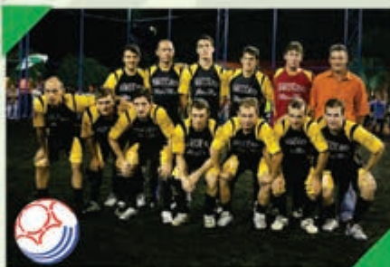
2º Lugar Equipe: A.J. SUPERMERCADO