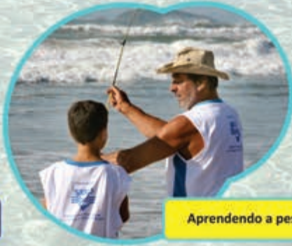
Aprendendo a pescar