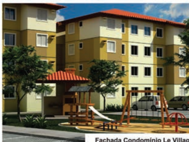
Fachada Condomínio Le Village