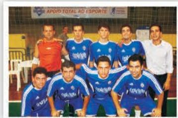
Equipe: EXPRESSIVA HOMEM