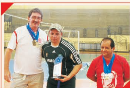
2º Lugar Geral de Joinville Equipe: LOJAS KOERICH