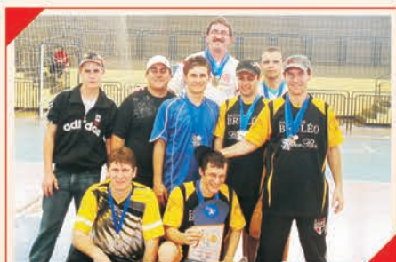
1º Lugar Geral de Joinville Equipe: AJ SUPERMERCADO