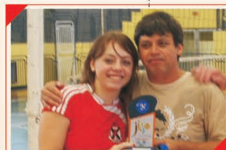
3º Lugar Geral de Joinville Equipe: ÓTICA GLOBO