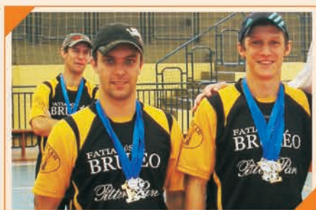
1º Lugar Pênalti de Joinville Equipe: AJ SUPERMERCADO