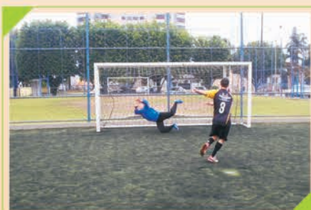
Disputa de Pênalti