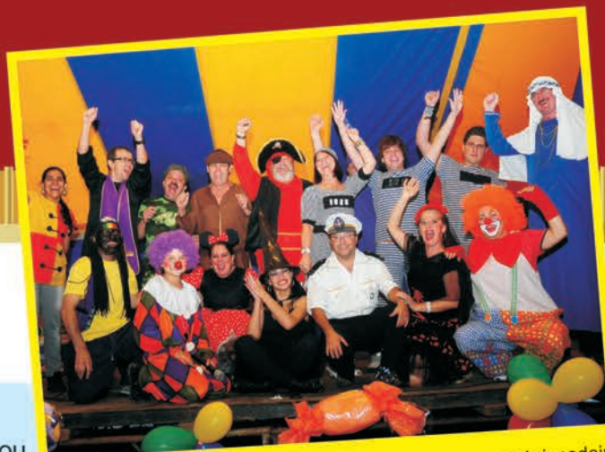
Diretores e funcionários do SECJ também entraram na brincadeira no Dia das Crianças. Fantasiados, eles marcaram presença nesta grande festa divertindo-se tanto quanto os convidados.

Na semana do Dia das Crianças, o Sindicato efetuou o sorteio eletrônico de quase 100 brinquedos com a participação de todos os associados com filhos até 12 anos. A criançada se divertiu a valer e fez a maior festa com mais esta surpresa do SECJ.