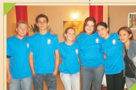
Equipe de Truco VEÍCULOS STEIN