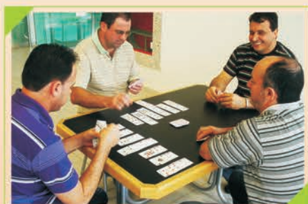
Disputa de Canastra