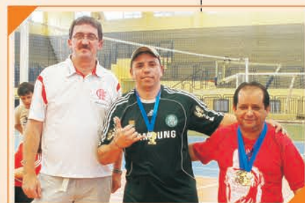
1º Lugar Truco de Joinville Equipe: LOJAS KOERICH