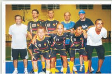
Equipe: CORREIOS AMERICANAS