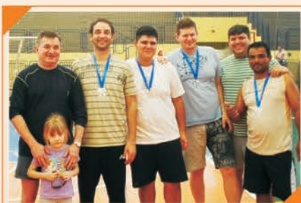
2º Lugar Volley de Joinville Equipe: SCHERER AUTOPEÇAS