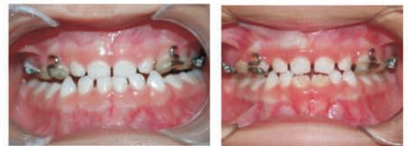
Correção da mordida cruzada esquelética na dentição de leite