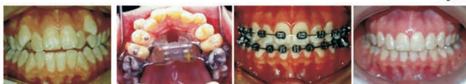
Tratamento ortodôntico com expansão e extração de dentes permanentes

Quando o paciente chega ao consultório já com dentição permanente, as alternativas ficam em conseguir espaços com ampliação do arco dentário ou muitas vezes em extrair dentes permanentes para acomodar os demais. (veja figura C)