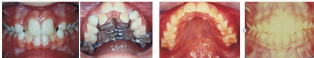
Fase da dentição mista onde o aparelho expansor proporciona alinhamento dos dentes

Quando o paciente chega ao consultório já com dentição permanente, as alternativas ficam em conseguir espaços com ampliação do arco dentário ou muitas vezes em extrair dentes permanentes para acomodar os demais. (veja figura C)